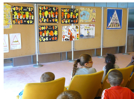
23 juin 2011 en salle des fêtes de la préfecture : Remise des prix aux élèves ayant participé au concours de la Sécurité routière.

32 actions ont été organisées par les communes du Val-de-Marne.